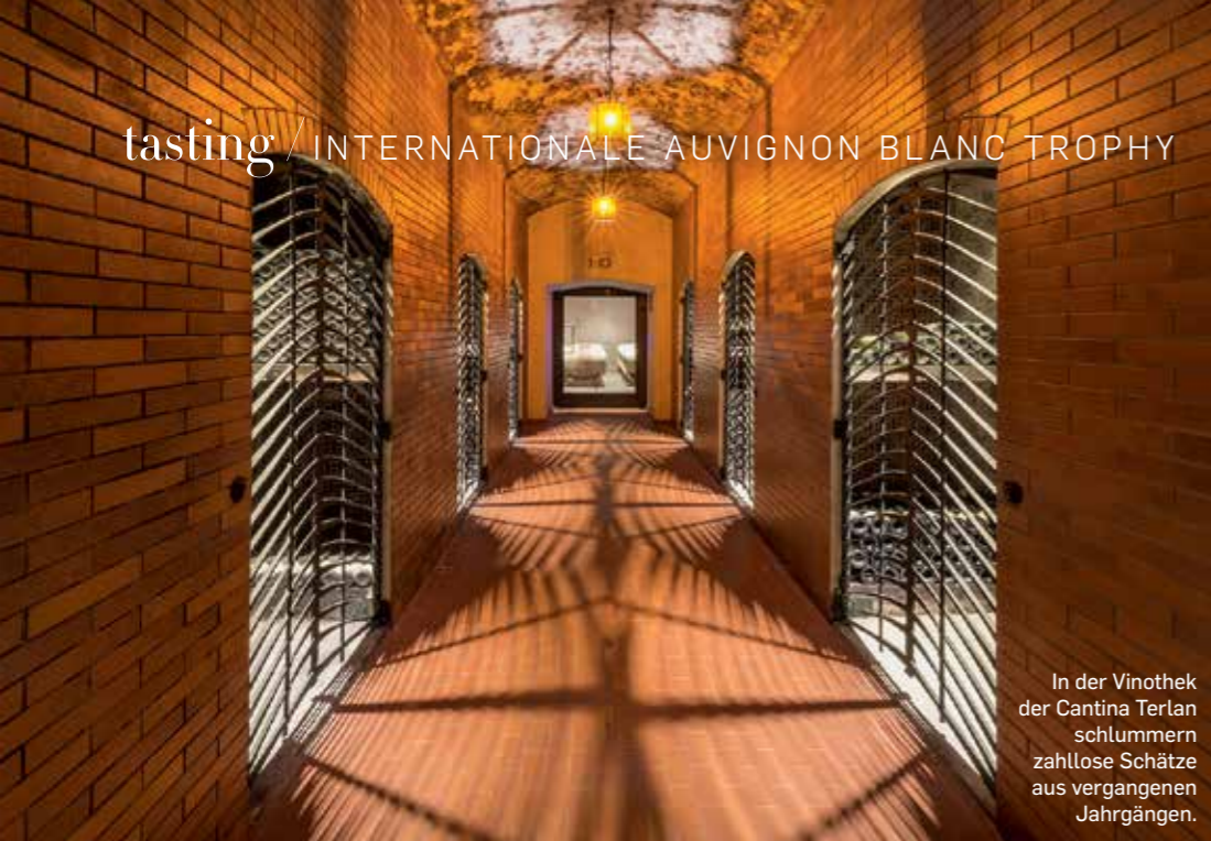
In der Vinothek der Cantina Terlan schlummern zahllose Schätze aus vergangenen Jahrgängen.